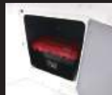
13 センターストレージ