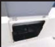
9 スターンストレージ