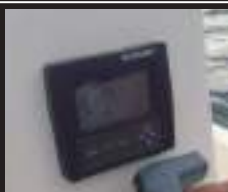
4 SUZUKI DF60 デジタルモニター