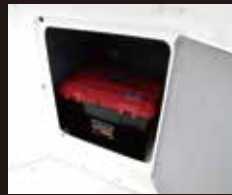
13 センターストレージ