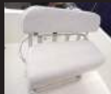
6 ネプチューンリーニングシート