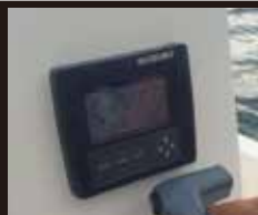
4 SUZUKI DF60 デジタルモニター