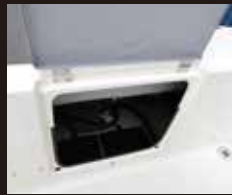
9 スターンストレージ