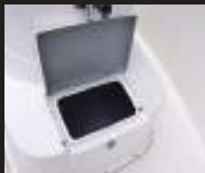
3 ライブウェル(大型イケス)

外循環ポンプライブウェル。 容量サイズ:横820mm×縦430mm×高さ300mm