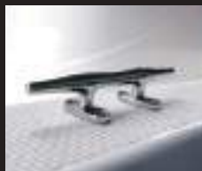
10 ステンレスクリート