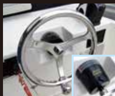
5 油圧ステアリングホイール

外循環ポンプライブウェル。 容量サイズ:横620mm×縦430mm×高さ300mm