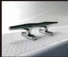
10 ステンレススクリーン