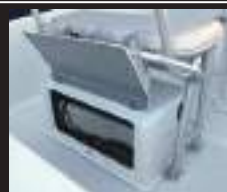
11 55Lステンレス製ガソリンタンク