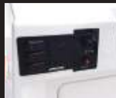
12 サウザースイッチパネル