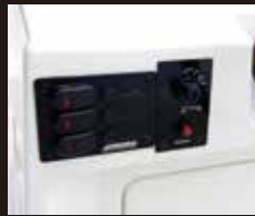
12 サウザースイッチパネル