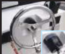
5 油圧ステアリングホイール

外循環ポンプライブウェル。 容量サイズ:横820mm×縦430mm×高さ300mm