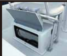
11 55Lステンレス製ガソリタンク

内蔵タイプに変更可能。残量メーター、フューエルキャップ付き ¥110,000 (税抜)