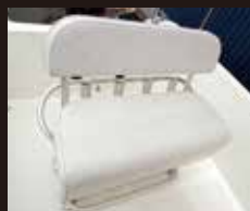
6 ネプチューンリーニングシート