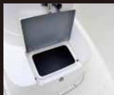
3 ライブウェル(大型イケース)

外循環ポンプライブウェル。 容量サイズ:横620mm×縦430mm×高さ300mm