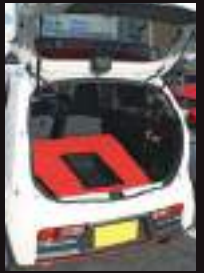
▲エコカー 小型軽自動車▶