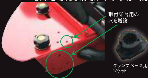
取付架台用の 穴を増設