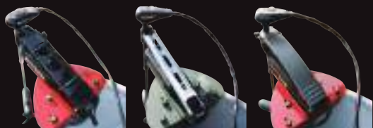
モーターガイド 21ゲーター スプリングマウント

主要マウント4タイプの穴加工済みですので、穴明け加工が不要です。 (ボルトも付属しています)