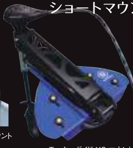
モーターガイド X3 マウント

通常このくらいコンパクトな サイズになるとショートカット を施したマウントしか対応で きませんが、パウデッキを分 割構造にすることにより ベースは限りなくコンパクト にエレキは、ノーマルマウント のままでもしっかり固定が 出来るので、そのままでも ショートマウントのような感覚 で使用することができます。