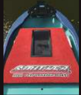
▲川名造船製14FT ※10FTも同様